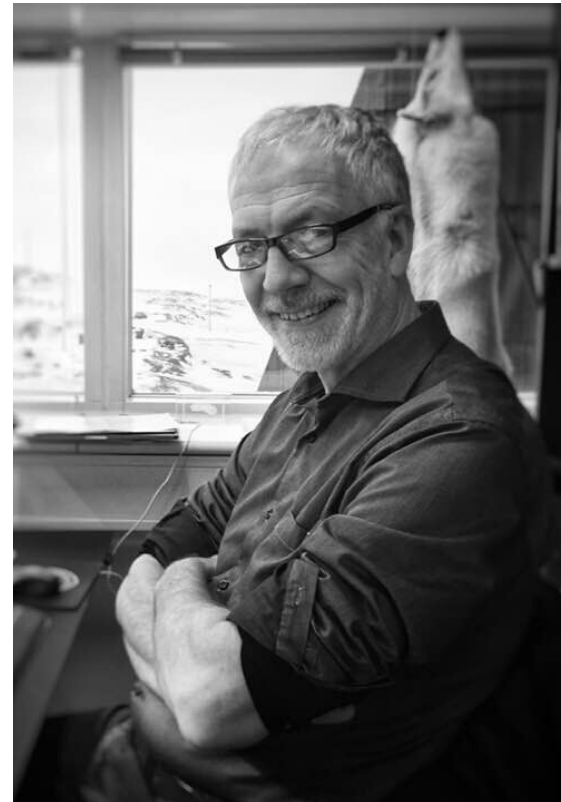
Ilisimatusarfik, januar 2020