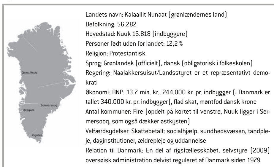
Figur 6.1. Fakta om Grønland 2014.

Nedenfor i Figur 6.1 er der opstillet en række faktuelle oplysninger om Grønland: