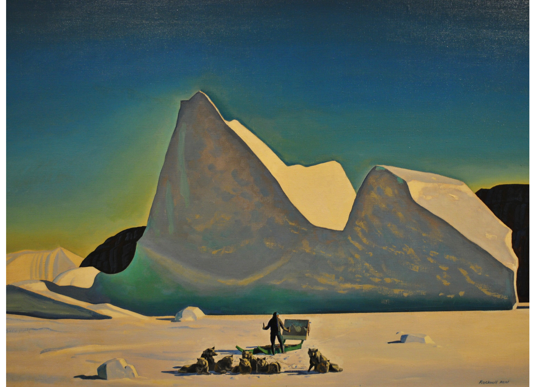
Kalaallit Nunaanni asimi qalipaalluni Rockwell Kentip imminut assilisaa.