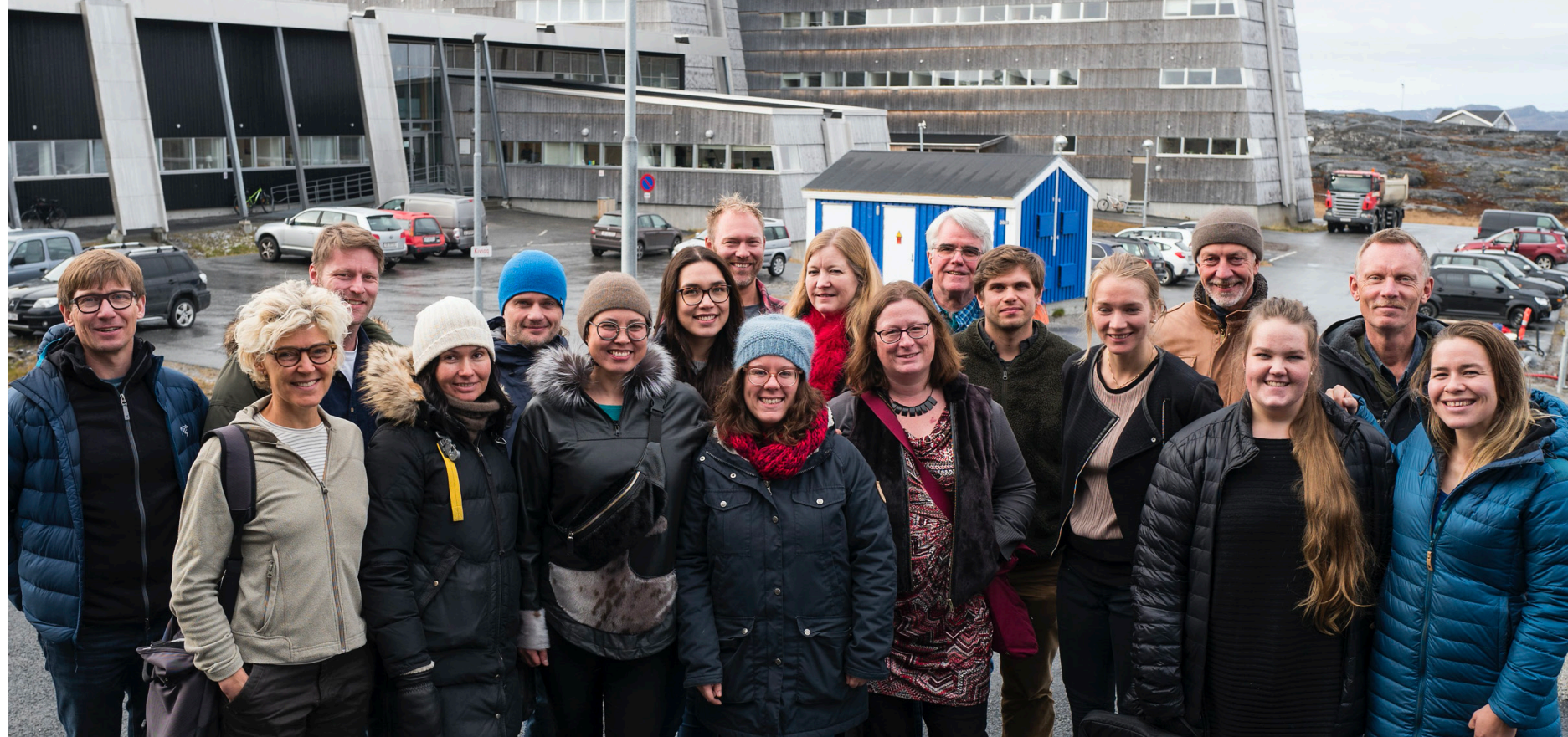
Suliniummi Qimmii peqataasut Nuummi Ilimmarfiup silataani.

Qimmeq qimuttoq pillugu ilisimasat nutaat siaruarluar-torujussuupput, nunarsuarmi tamarmi, nunatsinni nu-